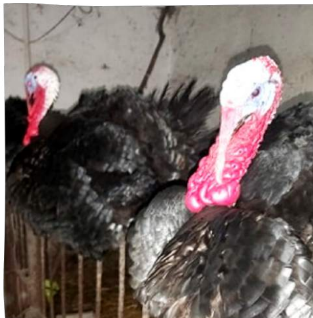
Źródło archiwum Inspektorat TOZ w Polsce Oddział w Zabrzu

Jak możesz dbać o innych (ludzi czy zwierzęta) jeśli nie potrafisz zadbać o siebie? Doskonale wiem, że nasi pracownicy i wolontariusze nigdy by nie pozwolili aby którykolwiek z ich podopiecznych chodził głodny, niewyspany i sfrustrowany. Jednak sami nagminnie narażają się na te stany. Dlatego wiemy jak ważny jest dla naszych inspektorów balans między inspektoratem, życiem prywatnym i zawodowym. Po trzecie wiemy, że z dnia na dzień nie zbawimy całego świata. Robimy tyle, ile jesteśmy w stanie zrobić. Czasami gdy sytuacja tego wymaga to potrafimy powiedzieć nie. Ostatecznie to my ponosimy odpowiedzialność za zwierzęta, którymi się zajmujemy i jeśli nie wyznaczymy sobie granic w pomaganiu, to ostatecznie ucierpią na tym wszyscy. Ostatnio jednak wydarzyło się tyle, że uznałem, że warto żeby taki tekst powstał. Jak wiecie do niedawna mieliśmy po raz pierwszy od paru lat silny mróz. Jak zwykle w tego typu sytuacjach nasz telefon interwencyjny strasznie się rozdzwonił ze zgłoszeniami dotyczącymi marznących zwierząt. I to oczywiście nie jest problem, ponieważ sami prosimy aby reagować w tego typu sytuacjach. Problem zaczyna się jednak w momencie, gdy nasi inspektorzy zaczynają być traktowani jak zawodowa służba mundurowa.